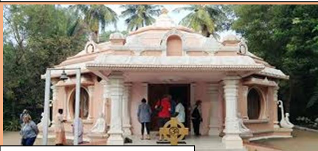
ASHRAM DE SHANTIVANAN

Plantea esta búsqueda a través de las diversas tradiciones religiosas, trascendiendo los límites que ellas mismas marcan, revelando la unidad que subyace a todas y reconciliando sus diferencias.